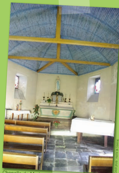
Chapelle de Madoux

Respectons les espaces naturels et protégés Restons sur les sentiers balisés Ne laissons ni trace de notre passage, ni déchets Respectons la flore Respectons la faune sauvage et la tranquillité des troupeaux Respectons le code de la route Gardons les chiens en laisse Réfermons les clôtures et les barrières