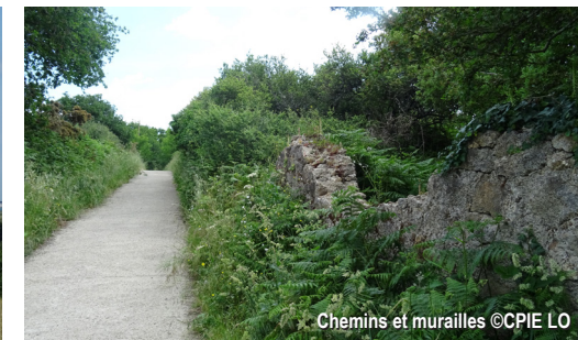
Chemins et murailles