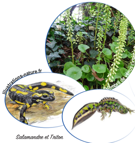
Salamandre et Triton