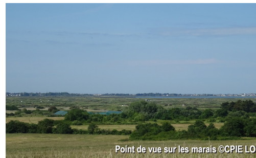
Point de vue sur les marais