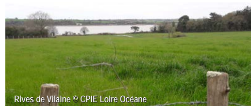
Rives de Vilaine

Le circuit emprunte de petites routes et nécessite la traversée d'une RD. Soyez prudents ! Prévoir des bottes en hiver (sentier enherbé très humide)