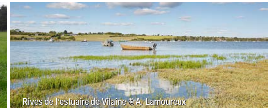
Rives de l'estuaire de Vilaine