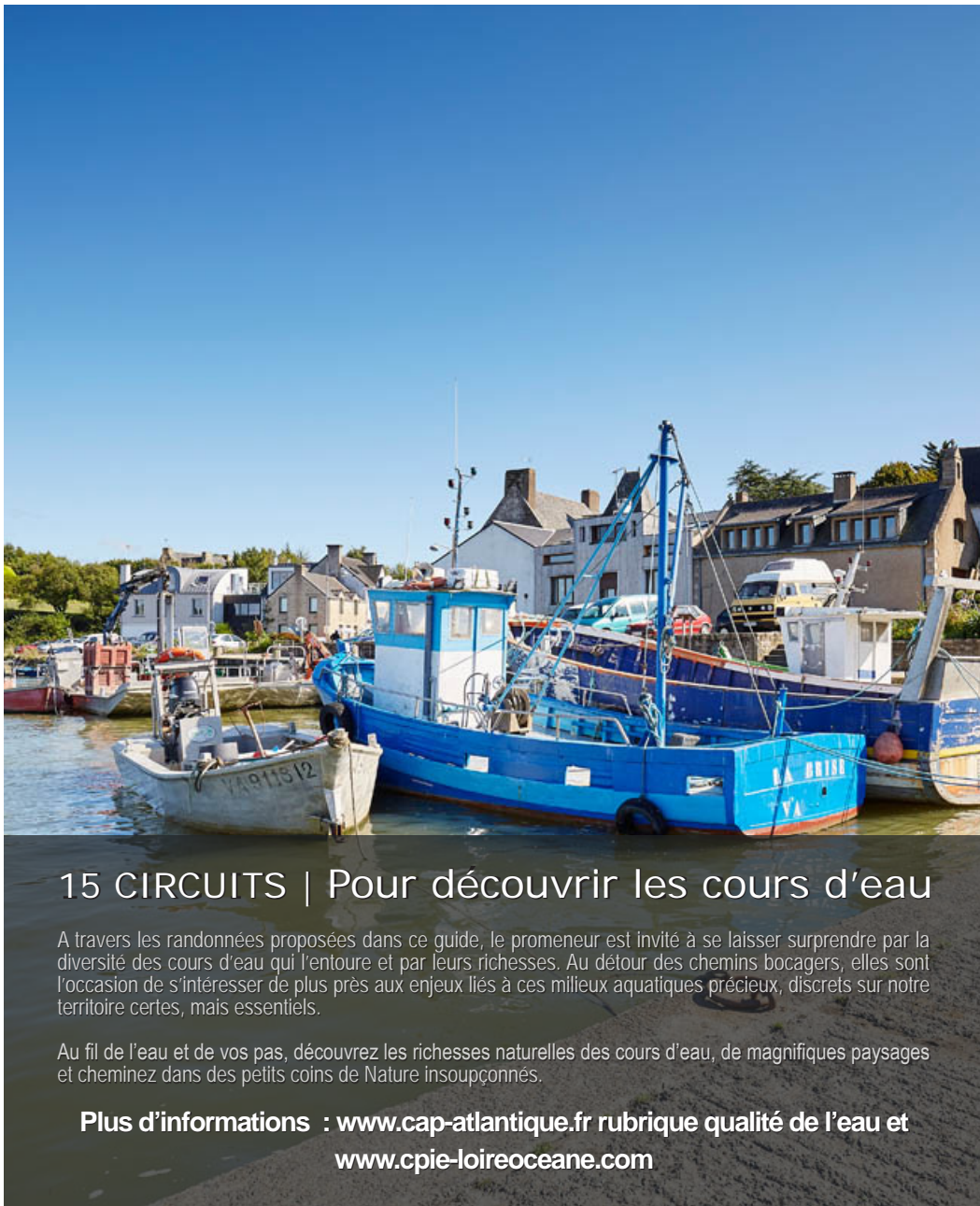
Maquette & Réalisation graphique : Office de Tourisme Intercommunal La Baule - Presqu'île de Guérande.